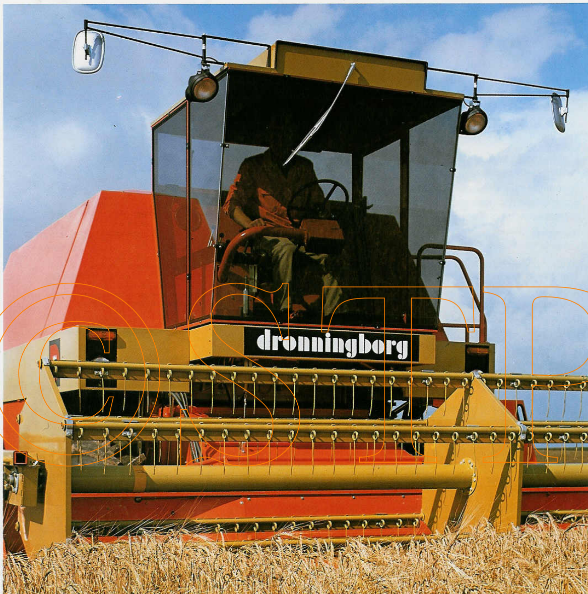
Panoramakabinen med arbejdslygter er ekstraudstyr.